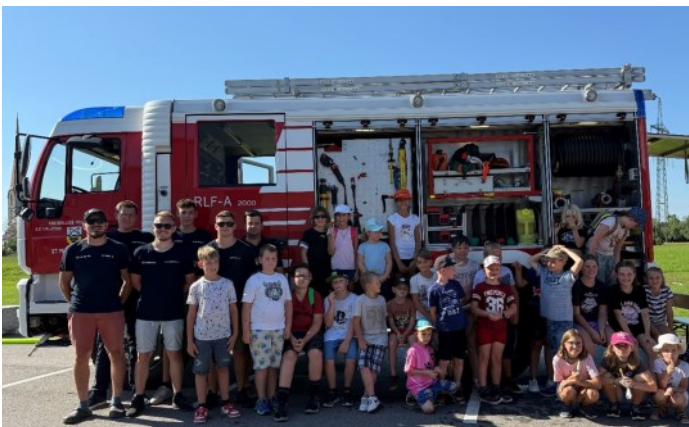
Foto: Tag der Feuerwehr

Ein Highlight des Sommers war der „Tag bei unserer Feuerwehr“. Im neuen Feuerwehrhaus waren die Kinder von den vielfältigen Aufgaben und Möglichkeiten fasziniert.